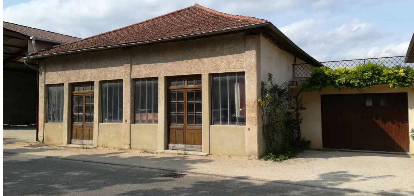
▲ Perspective de la menuiserie avant travaux