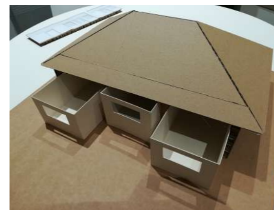
▼ Maquette concept du projet